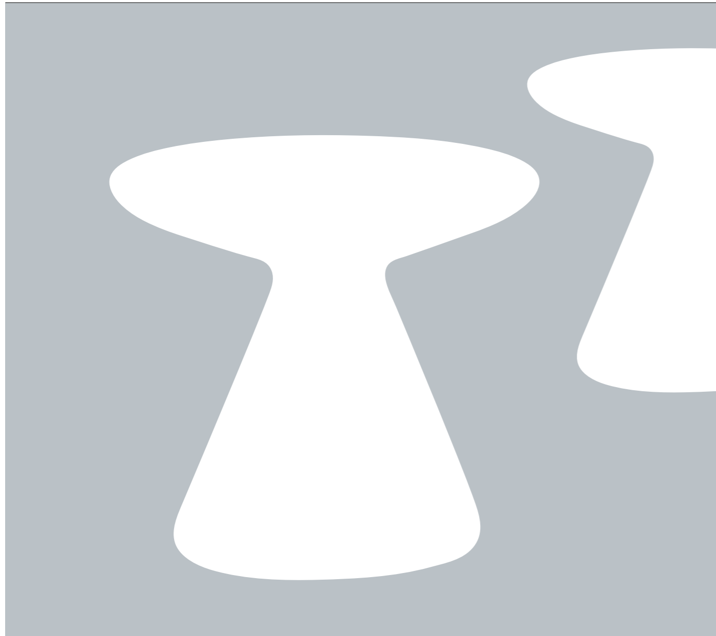
Pianta / Top view

Hand-turned ceramics, white or black enamelled. Lathe-processed maple wood.